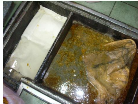
吸油シート投入-瞬時に吸着